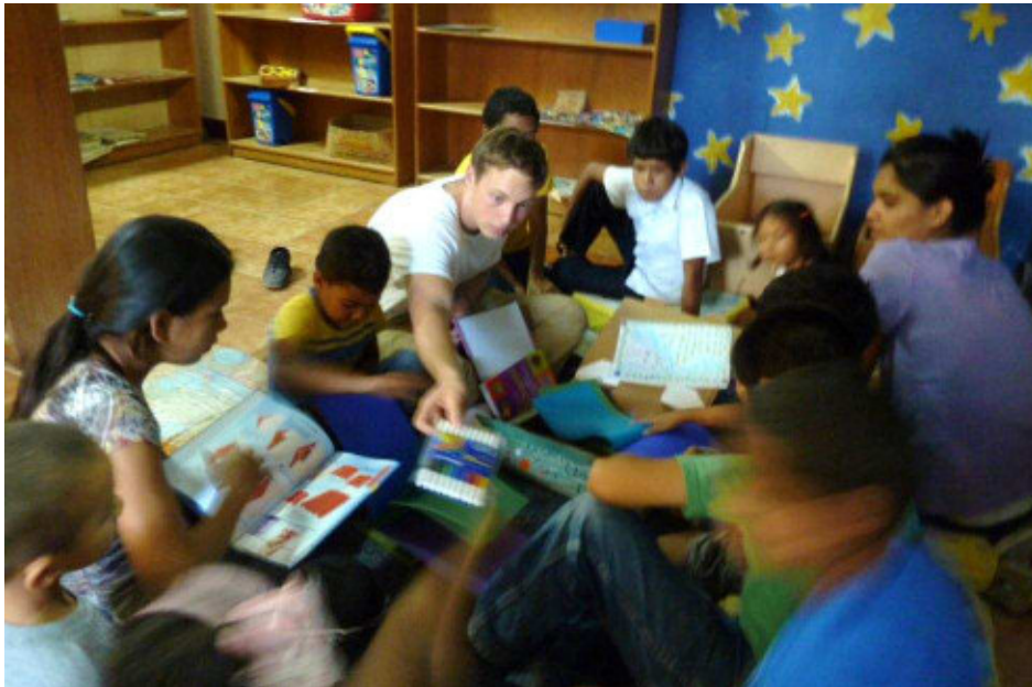
Auspacken von dem Paket aus Deutschland

Antworten von dort gespannt. Ich glaube, der Briefaustausch kann für beide Seiten eine interessante und wichtige Erfahrung sein.