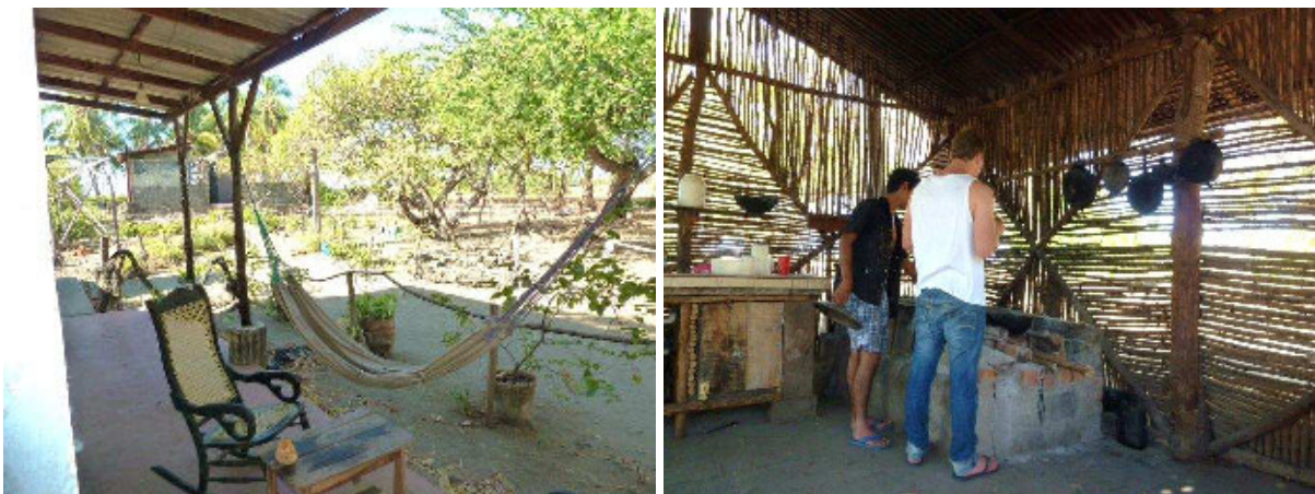
Kochen auf der Finca „Buena Onda“

Einen Tag vor meinem Geburtstag habe ich mich mit Freunden spontan entschlossen, über das Wochenende einen kleinen Urlaub zu machen, und wir sind nach Leon gefahren. Leon ist eine schöne, durch den Tourismus sehr internationale, alte Kolonialstadt und nur eine halbe Stunde mit dem Bus entfernt von den Sandstränden des Pazifiks. Dort gibt es wunderschöne Plätze zum Surfen, Baden und Entspannen. Etwas abseits von dem teuren Küstenort Poneloya haben wir an dem palmengesäumten Strand auf einem kleinen Campingplatz übernachtet. In der nicaraguanischen Hitze haben wir tagsüber den kühlen Ozean genossen und am Abend über dem Feuer Alnatura Ravioli gekocht und Kokosmilch getrunken.