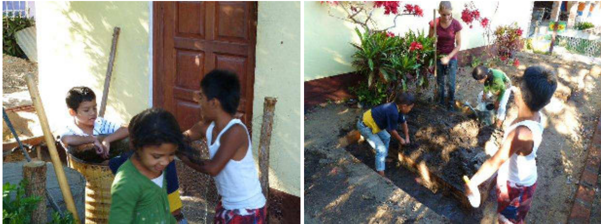
Arbeit mit Kindern im Garten

Bei der Arbeit im Garten, weil sie anders als das Basteln gemeinsam in der Gruppe geschieht, gibt es aber auch leicht Konflikte unter den Kindern. Beispielsweise müssen sie sich verständigen, wer zuerst gießen darf oder die Samen einsetzt – sie arbeiten eben zusammen. Dabei ist es wichtig, dass sie sich als Gruppe einigen, denn auch der, der sich am besten durchsetzen könnte, ist letztlich auf die Hilfe und Mitarbeit aller angewiesen. Keiner kann ohne die anderen. Dass die Kinder diese wertvolle Botschaft mitnehmen und die Konfliktlösung fair bleibt, das müssen wir als Leiter versuchen zu erreichen. Dass Konflikte generell aufkommen, ist dabei nichts negatives, denn wir können dafür sorgen, dass sie im Rahmen bleiben und die Lösung aktiv begleiten. Die Kinder lernen so hoffentlich kompetenter mit Konflikten umzugehen.