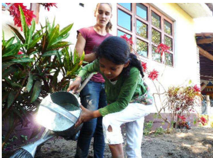
Pflanzen gießen im neuen Garten