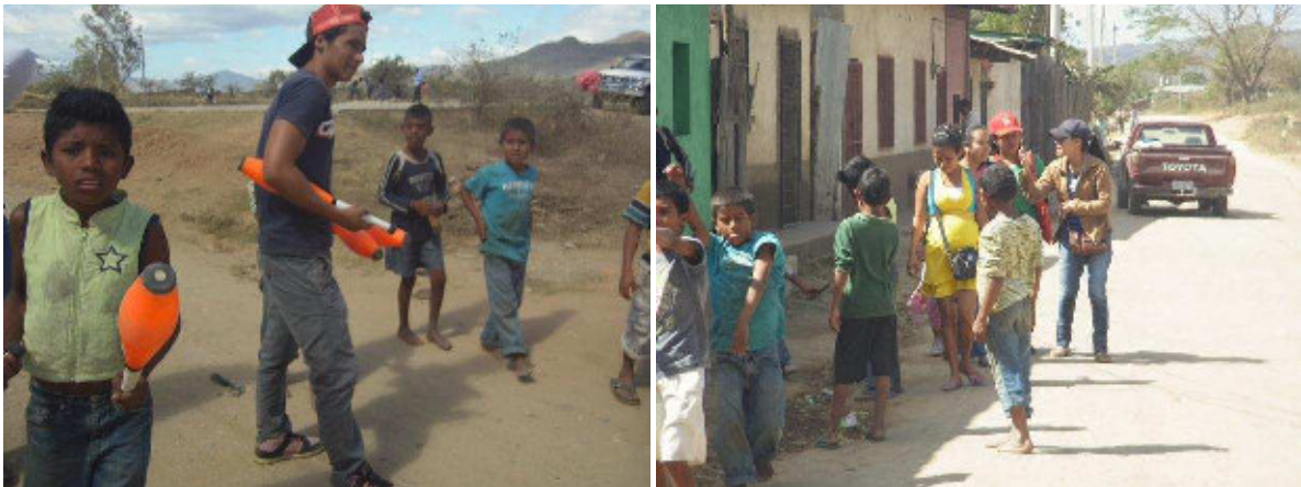
Der Zirkus hilft beim Werben neuer Schüler für die Montessori-Vorschule

Wie der Deutschunterricht hat auch der Zirkus von neuem begonnen. Die Jugendlichen haben sich vor einigen Wochen getroffen, um darüber zu sprechen, was sie in diesem Jahr realisieren wollen und wie der Zirkus strukturiert sein wird. Ich habe dabei den Eindruck, dass die Chavalos in der Art, wie sie gemeinsam Dinge organisieren und Aktivitäten planen, viel reifer geworden sind. Ich denke, sie wissen, dass nach dem Wechsel der Zirkusleitung, sie nicht alle Aufgaben auf einen einzelnen Direktor aufbürden können, sondern jeder einzelne Verantwortung tragen muss. Wie sie in den Treffen der Gruppe diskutieren und Lösungen suchen, hat mir gefallen.