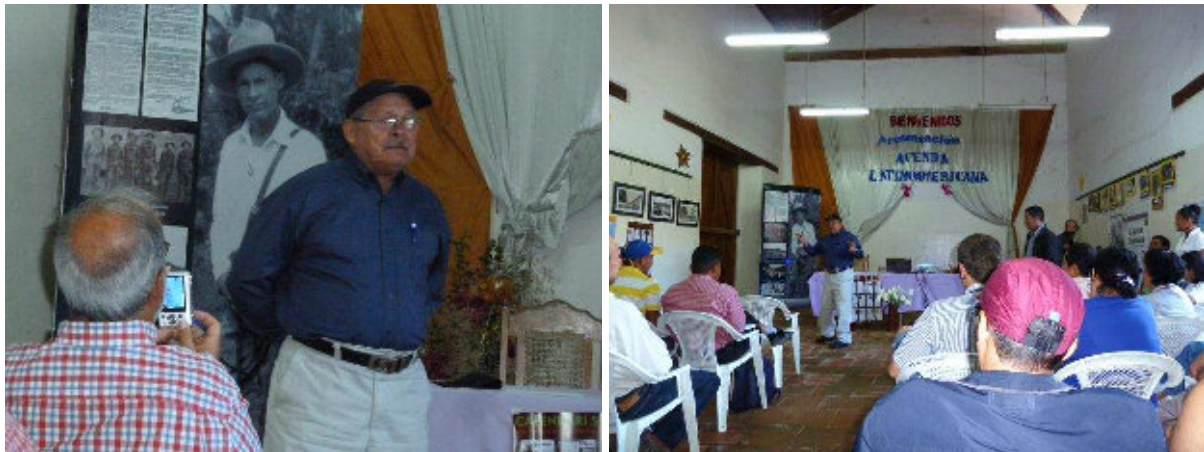
Publikumsdiskussion bei Vorstellung der Agenda

Die Organisation INPRHU, die viele verschiedene, vor allem soziale, Projekte hier in Ocotal leitet, hat uns Freiwilligendienstleistende zu der Vorstellung der „Agenda Latinoamericana Mundial 2013“ eingeladen. Eine Gruppe der Mitwirkenden an jener Zeitschrift, eine Sammlung aus Analysen und Kommentaren über Wirtschaft, Politik und Gesellschaft, reist momentan durch Lateinamerika, um die Agenda vorzustellen.