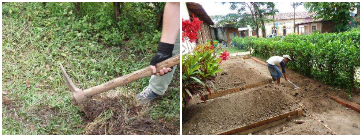
Beginn und Abschluss der Arbeiten am Garten