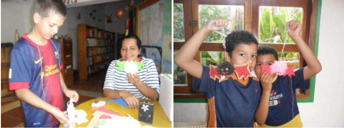
Basteln der Fledermäuse

Die Fledermäuse haben wir aus Wolle und Schaumfilz gemacht. Für den Körper der Fledermaus haben die Kinder die Schnur viele Male um einen Ring aus Pappe gewickelt und dann so umschnürt, dass sie einen Ball ergeben hat. Diesen Ball haben wir auf die aus dem Schaumfilz ausgeschnittenen Flügel geklebt. Zum Schluss haben wir noch das Gesicht geformt und die Kinder konnten die Flügel nach ihren Vorstellungen verzieren. Mit ihren fertigen Fledermäusen haben die Kinder zusammen in der Bibliothek gespielt.